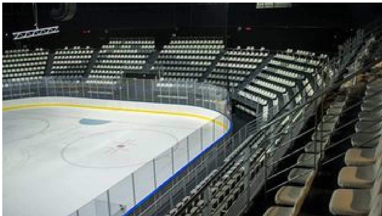
"Il y a une éclaircie", mais "ça va être très difficile malgré ces aides", réagit la fédération de hockey sur glace après les annonces pour le monde du sport