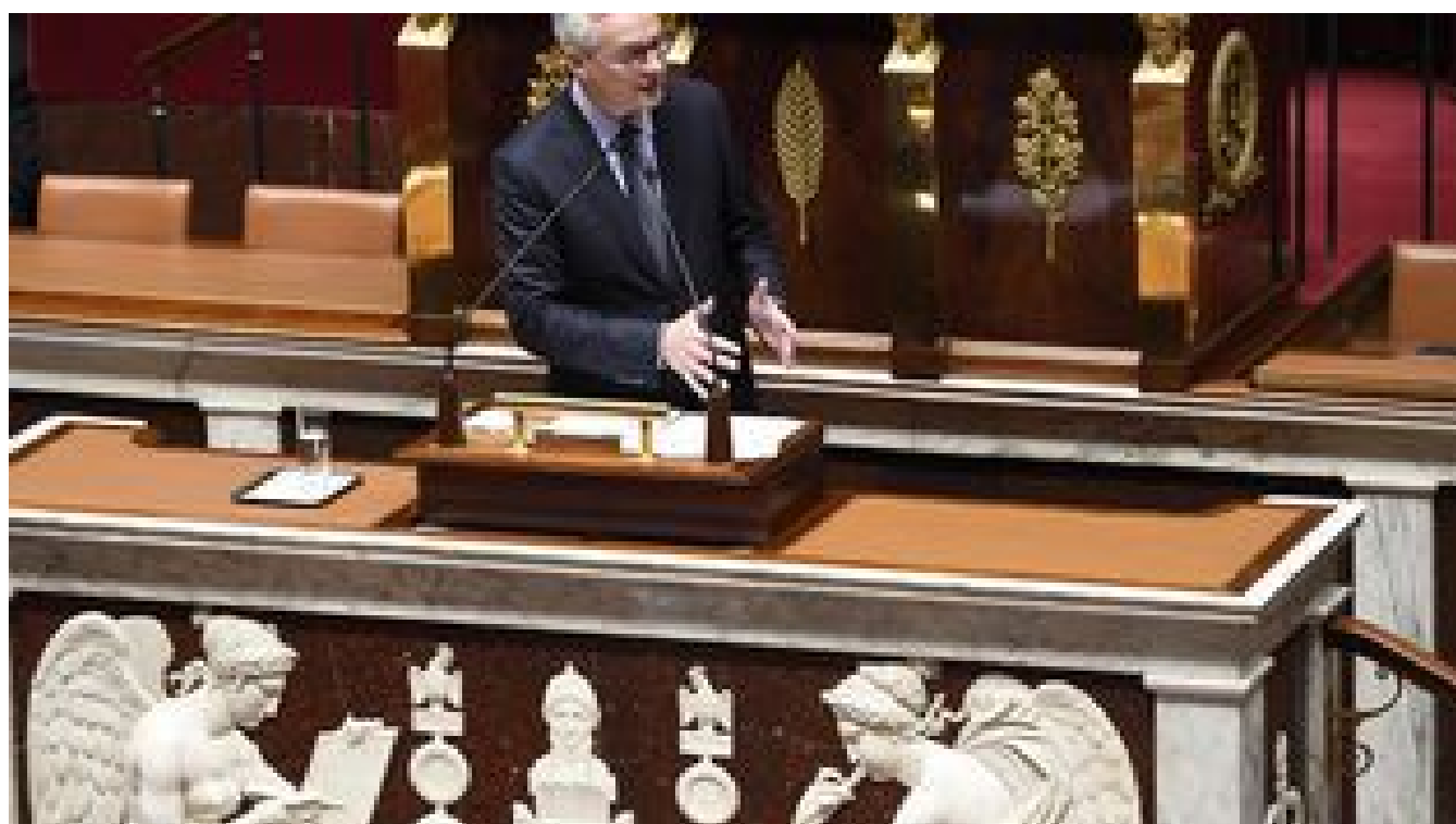
Plan de relance : le projet de budget 2021 adopté par l'Assemblée nationale en première lecture