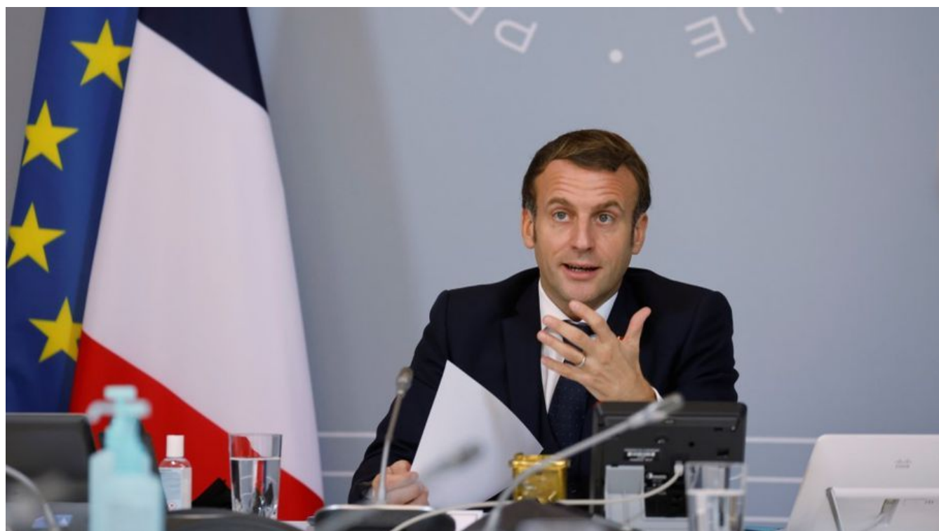
Le président Emmanuel Macron s'exprime lors d'une visioconférence avec des représentants du monde du sport à l'Elysée, à Paris, le 17 novembre 2020.

Emmanuel Macron a pris le pouls, mardi 17 novembre, d'un monde du sport français qui se sent délaissé, en cette période de crise du Covid-19. Entre la fermeture des salles de sport, le huis clos imposé qui laisse les caisses vides et la baisse des adhésions dans les clubs amateurs, le sport français est à la peine. Il a reçu 120 millions d'euros lors du plan de relance en septembre. Mais désormais, tout le secteur réclame un plan d'urgence. Voici ce qu'il faut retenir des annonces du président.