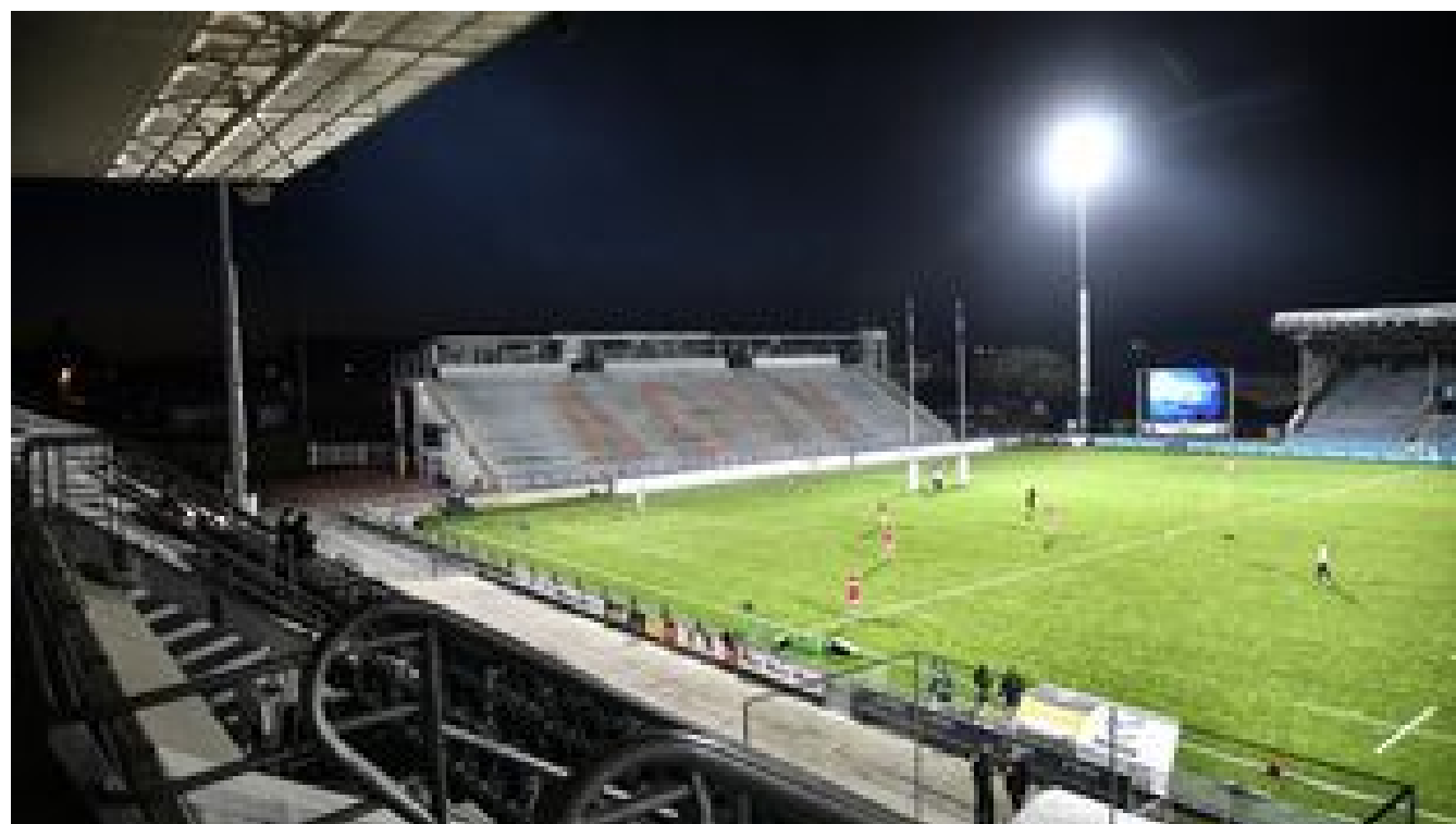
"On a l'impression de ne pas exister" : des représentants du monde sportif, chamboulés par le confinement, sont reçus par Emmanuel Macron